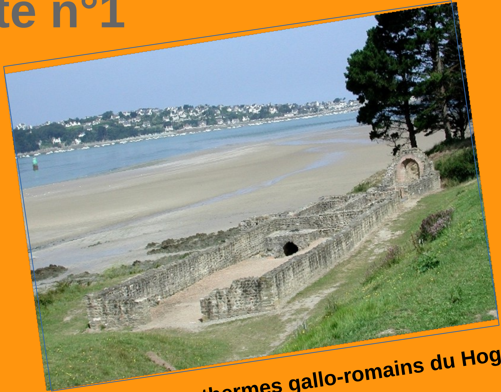
Les thermes gallo-romains du Hogolo